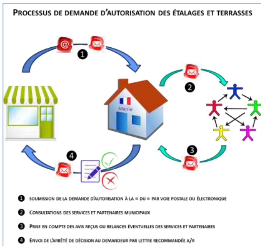
Graphique 1 : Processus de demande d'autorisation des terrasses et étalages

Les différentes étapes du processus global d'instruction des autorisations ont été reconstituées par les rapporteurs sur la base des entretiens avec les agents de la direction de l'urbanisme. Elles peuvent être présentées comme suit :